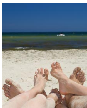
Muchas franquicias ofrecen servicios que facilitan la vida de los clientes en vacaciones.

Es ley de vida. Mientras unos disfrutan del verano, otros tienen que trabajar duro para ello. Es además, esta época, una estación propicia para muchas franquicias, que gracias al calor y a las vacaciones tienen en la temporada estival su periodo álgido de negocio y tienen que aprovecharlo. Estos conceptos de negocio se dedican a proporcionar servicios que hacen más fácil el verano a sus clientes o consumidores gracias a ideas como la climatización, el mantenimiento de la calidad del agua o los viajes.